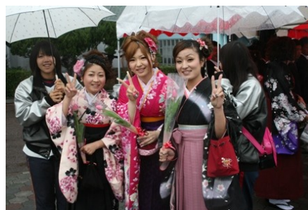
卒業生からの感謝の言葉はこちら