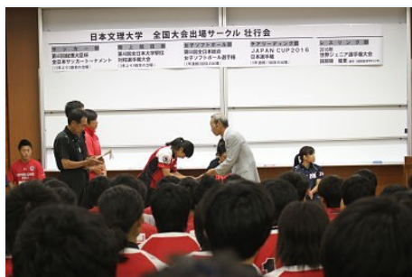
↑ 女子ソフトボール部