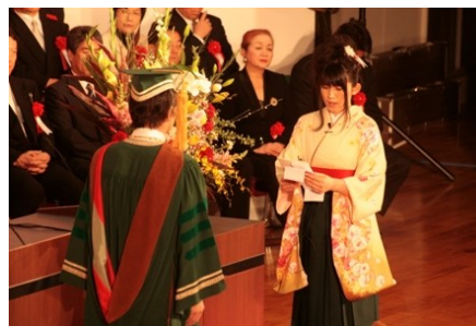
卒業生からの感謝の言葉